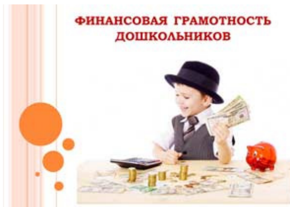
ФИНАНСОВАЯ ГРАМОТНОСТЬ ДОШКОЛЬНИКОВ

Воспитатель: Теперь мы знаем, как в вашей семье появляются деньги. Если сложить всё вместе – зарплату папы, зарплату мамы, пенсию бабушки и дедушки, то получается доход, составляющий семейный бюджет. Запомните это ребята.